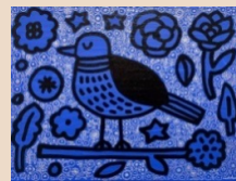
「鳥と花」 / 2023年制作

趣味の山歩きを通してたくさんの自然に触れる中で感じとった、愛らしいモチーフやかわいい動物たち、街歩きを通して出会ったふと心に残る風景など、どこかへ歩き出すことで感じた、心を豊かにしてくれるものを主にペンで描いた作品を展示します。