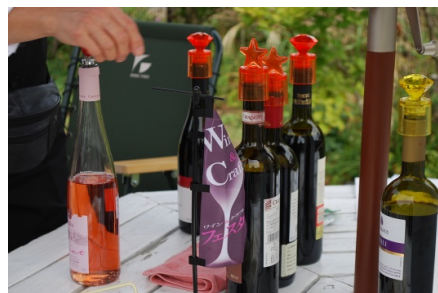
《写真はイメージです》

今から1万年ほど前、黒海とカスピ海に挟まれた地域でワインは発祥したと考えられています。その後、葡萄の栽培方法やワインの醸造方法は世界に伝播し、各地で様々なワインが作られました。今回のフェスタでも、シルクロードのワインをテイasting(無料/ドライバーの方は不可)してお楽しみ頂ける企画を用意します。特徴あるワインを飲み比べ、文化の違いを感じて下さい。