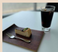
【新メニュー】チーズケーキ

美術館2Fラウンジ内にあるカフェ「キャラバンサライ」は、美術館に来館されたお客様だけでなく、フェスタ会場や甲斐小泉駅から自由に入出入りが可能です。三方ガラス張りの明るい店内から、八ヶ岳、南アルプスの眺めを楽しむことができます。