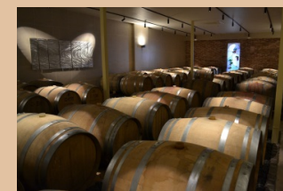
《写真はイメージです》