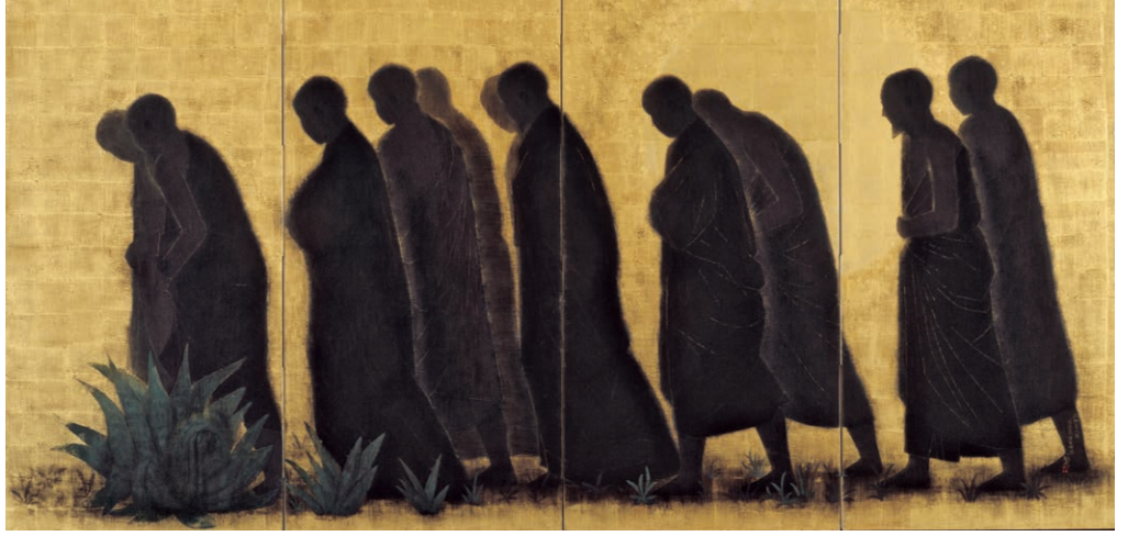
平山郁夫 《求法高僧東歸図》 1964年 平山郁夫美術館