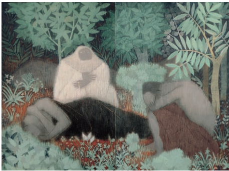
平山郁夫 《天山南路 夜》 1960年 佐久市立近代美術館 (展示期間：2024年5月9日～9月9日 予定)

平山郁夫シルクロード美術館は2024年に開館20周年を迎えます。当館ではこれを記念して「平山郁夫 一仏教伝来と旅の軌跡」と題し、平山郁夫の画業の起点となった《仏教伝来》(1959年)やその翌年に発表した《天山南路 夜》などの初期作、釈迦の生涯を描いた「仏伝シリーズ」、シルクロード各地を題材とした作品、制作に関連した資料を展示します。佐久市立近代美術館、平山郁夫美術館の特別協力のもと、若き日の平山郁夫の創作を振り返りながら、多彩な平山郁夫の絵画世界をご紹介します。