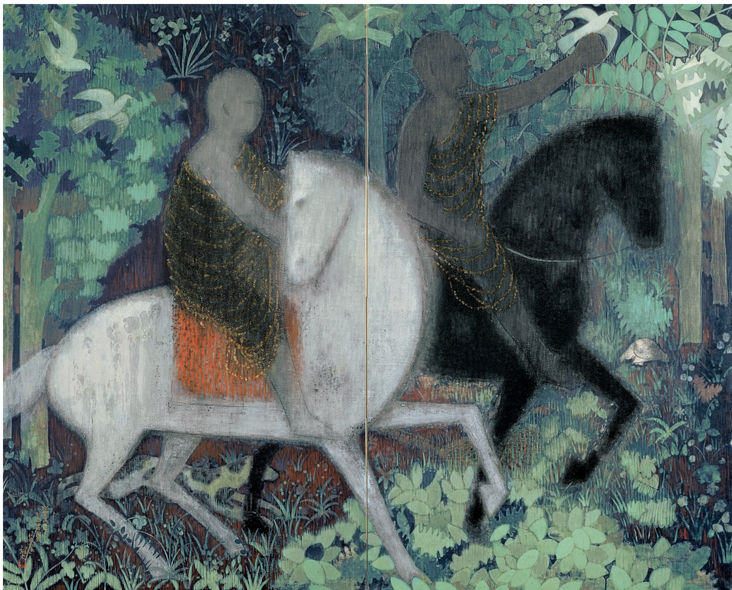
平山郁夫《仏教伝来》 1959年 佐久市立近代美術館

2024 3.23 sat — 9.9 mon 5月9日から一部展示替え 会期中無休