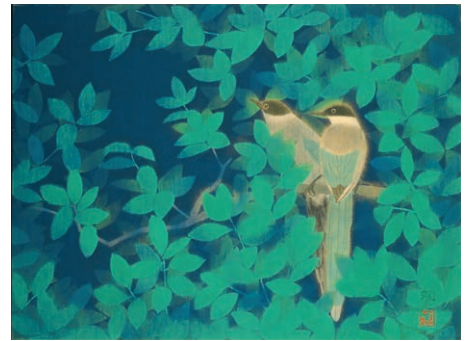
平山郁夫 《尾長島》 1971年