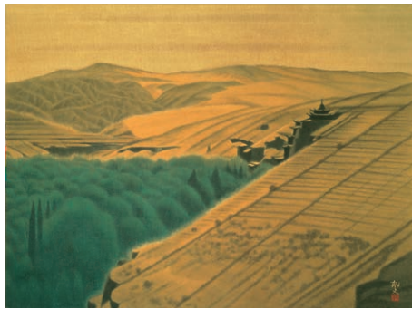
平山郁夫 《敦煌A》 1980年 平山郁夫美術館