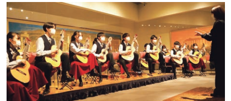
北杜高校ギター部

※受付にてコンサート参加の旨お伝えください。 10時～14時半まで無料で入館できます。