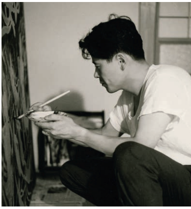
平山郁夫 1964年 東京・成増の自宅画室にて