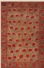
掛布、ブハラ、20世紀初め刺繍、228.0×154.0cm

今秋、平山郁夫シルクロード美術館では、20周年記念展第2弾として、シルクロードの要衝、ウズベキスタンの染織品を中心に、中央アジアの工芸品や装身具、平山郁夫が描いたシルクロードの風景や人々を展示いたします。さらに1階展示室5では、9月14日から10月14日まで、中央アジアを舞台にした森薫の人気漫画「大乙嫁語り」の原画を紹介する『大乙嫁語り展』を同時開催します。この秋は、ハケ岳南麓で中央アジアを体感してみませんか？