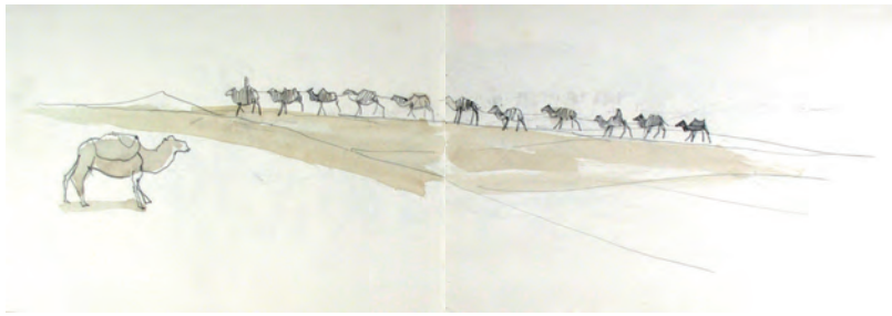
平山郁夫 スケッチブック「玄奘三蔵への道」より 1981年