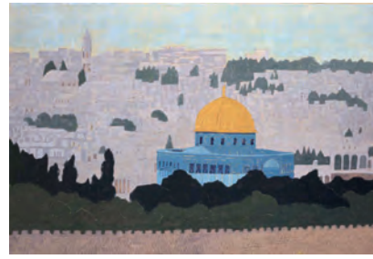
平山郁夫 画室に残されていた制作中の作品 2009年