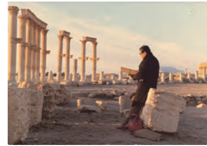
シリア・バルミラ遺跡にて 1979年

平山郁夫が生涯をかけて旅し、描き続けたシルクロードの風景や遺跡、旅先で出会った人々、砂漠を旅する隊商の行列...そこに込められた平和への願い、その壮大な絵画世界を平山夫妻が収集したシルクロードの美術品を交えてご紹介します。