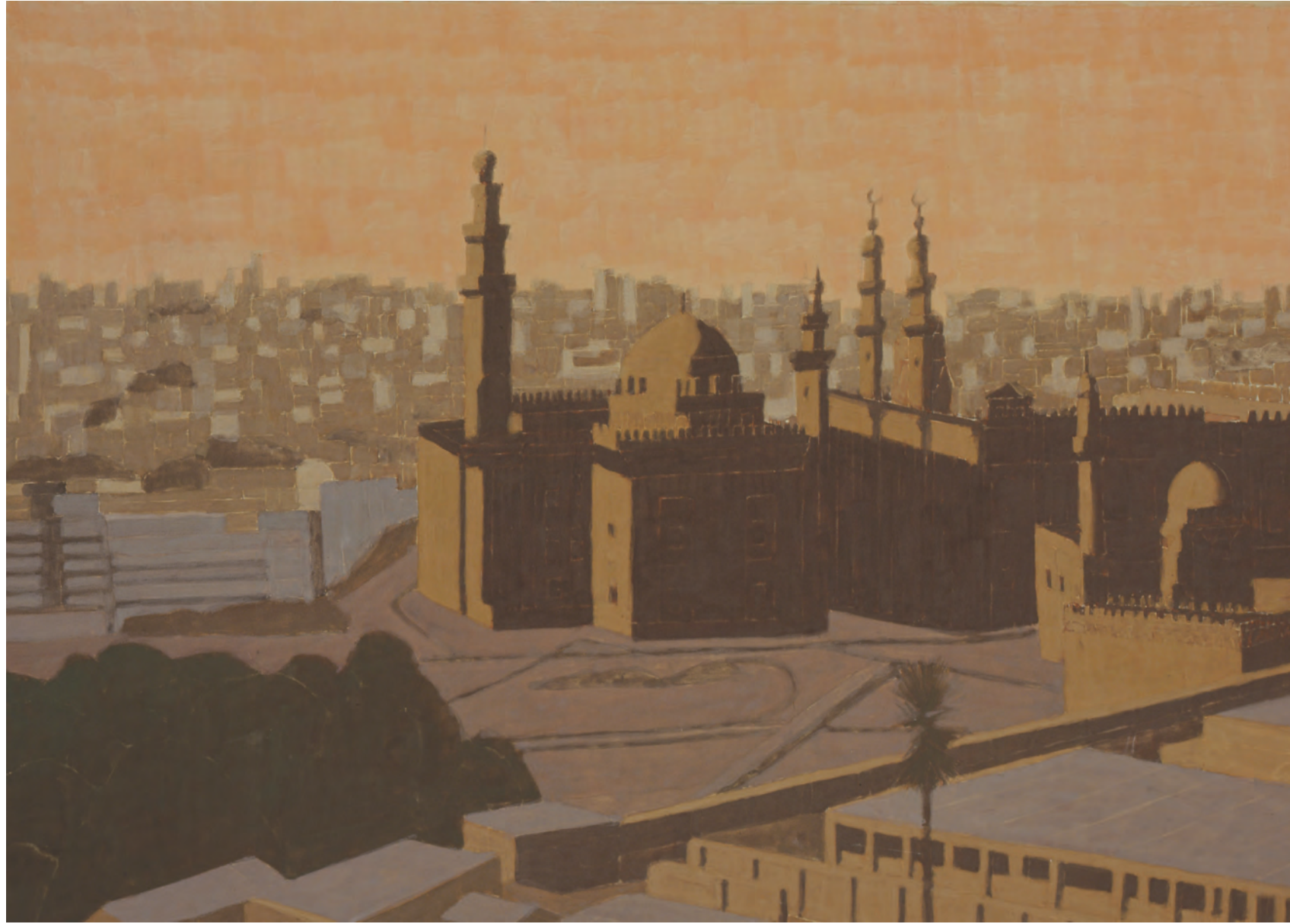
平山郁夫 画室に残されていた制作中の作品 2009年

休館日=会期中無休 開館時間=10:00-17:00(入館は16:30まで) 入館料=一般1200円 高大生800円 小中学生無料 *障がい者手帳をお持ちの方無料、介護者の方1名まで600円 *70歳以上の方、20名様以上の団体 各100円引